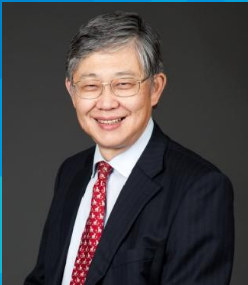
中原集團主席兼總裁 AM730主席 施永青先生 JP