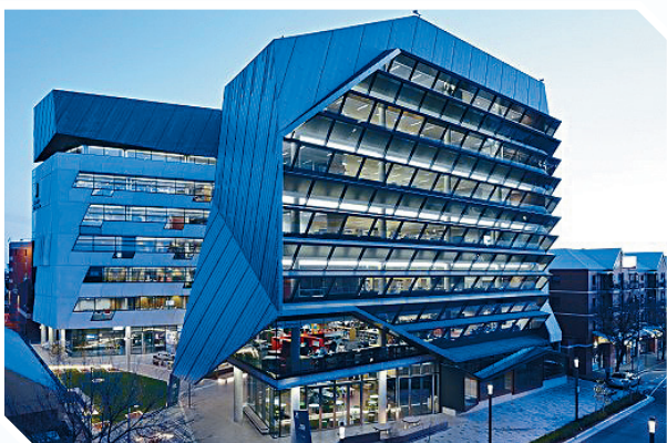
● 香港管理專業協會與南澳洲大學合辦首個在港兼讀工商管理碩士 (MBA) 課程，並設三個專業範疇科目，包括人力資源管理、市場學及財務。