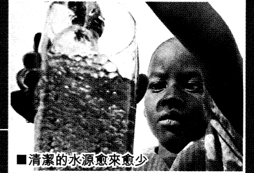
■清潔的水源愈來愈少