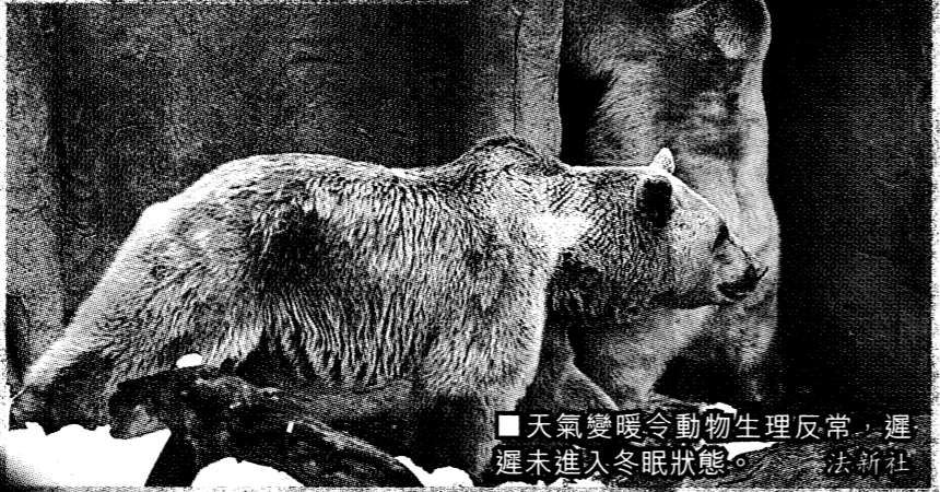
■天氣變暖令動物生理反常，遲遲未進入冬眠狀態。