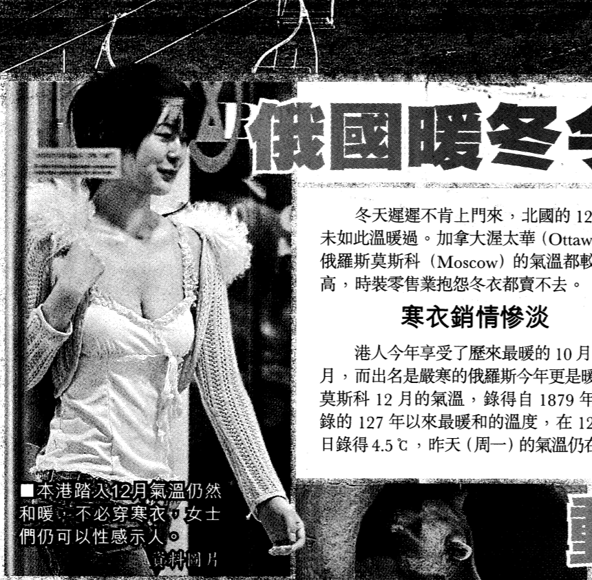
■本港踏入12月氣溫仍然和暖，不必穿寒衣，女士們仍可以性感示人。