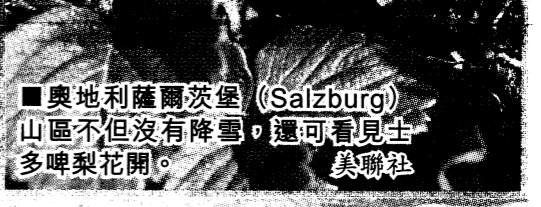
■奧地利薩爾茨堡 (Salzburg) 山區不但沒有降雪，還可看見許多啤梨花開。