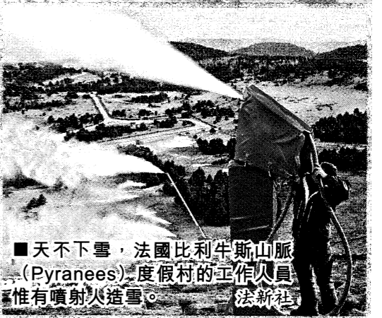
■天不下雪，法國比利牛斯山脈 (Pyrenees) 度假村的工作人員惟有噴射人造雪。

原本應在 10 月底前後開始冬眠，但南部地區動物園的黑熊踏入 12 月仍然未進入冬眠狀態，可是動作相當遲緩，看來非常疲累。