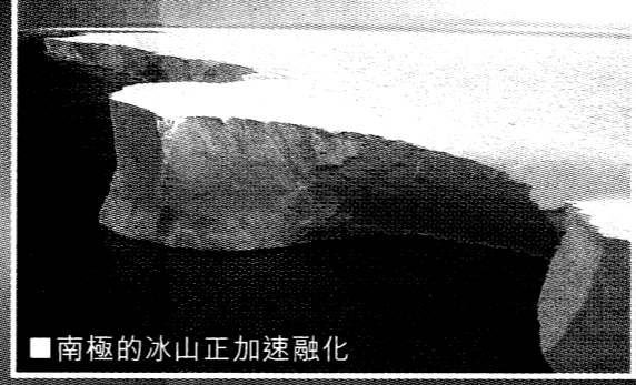
■南極的冰山正加速融化