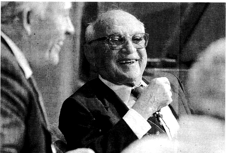
經濟學家佛利民曾說過，企業的基本任務就是為股東謀取最大的利潤，而從事其他對盈利沒有直接幫助的活動，都是屬於濫用股東資源或缺乏效率，今天這個論調已不合時宜。