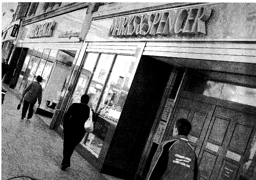
馬莎百貨最近宣布只向取得公平貿易標誌的生產商採購茶和咖啡

在英國擁有四百家分店的馬莎百貨最近宣布把旗下咖啡和茶產品總計三十八個品牌轉到公平貿易。這家連鎖店已在其二百家Cafe Revue咖啡店中專門銷售公平貿易的茶和咖啡。它還大幅增加購買使用公平貿易棉花的襯衣和其他產品。馬莎百貨在「公平貿易雙週」期間宣布有關消息。這一個為期兩周的活動推廣公平貿易產品，內容包括來自發展中國家農民的巡迴演講，他們告訴英國人公平貿易如何援助了他們的社區。